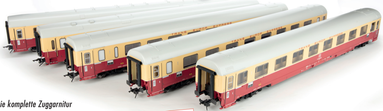
Die komplette Zugarnitur